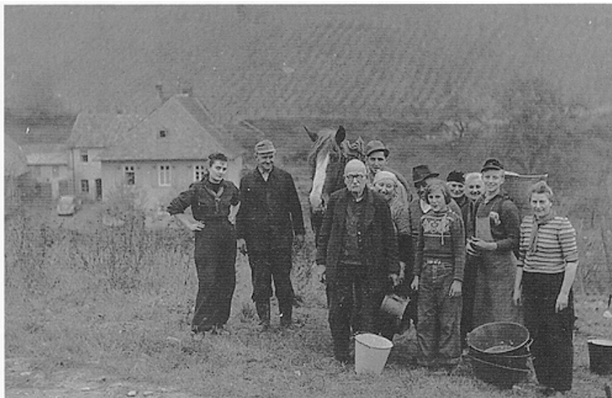
Weinlese auf der Kühns Mühle vor 1960